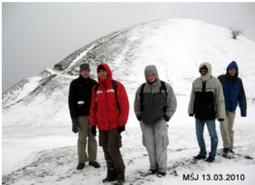
Zdjęcie wykonane przez uczestników wycieczki w ramach obozu w Palszów.